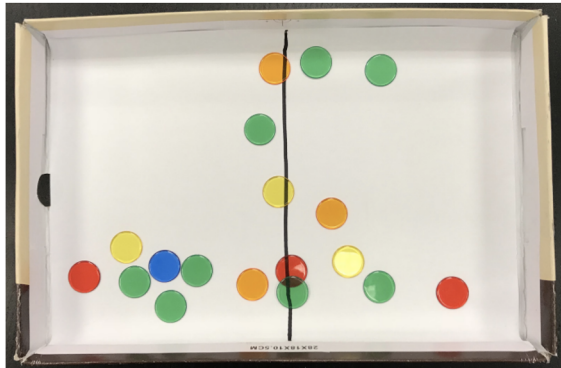
Alunos jogam contadores dentro da tampa de uma caixa

Quando jogamos contadores dentro da tampa de uma caixa dividida em dois lados (direito e esquerdo):