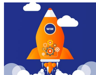
Gráfico do Emoji 6º ano a 8º ano